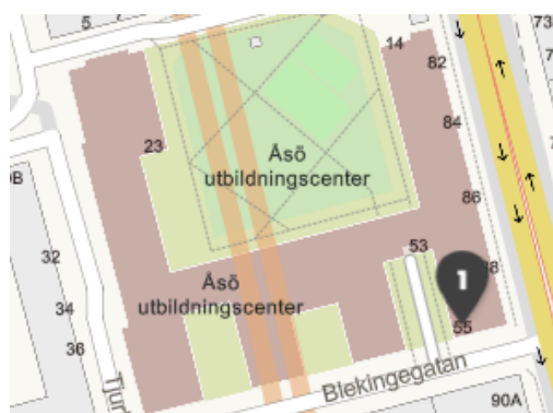
Skolans placering på karta.

Vidare förklaring till utbuktningarna kan vara Smektitlera, ett pulveriserat lermineral, i ballasten, vilket absorberar vatten och påföljande svällning medför sprickor i betongen. Svällningens omfattning är relaterad till mängden smektit i ballasten, samt fuktbelastning. Sprickor på grund av svällning medför ökad risk för frostsador och armeringskorrosion vilket i kan medföra en accelererande synergi.